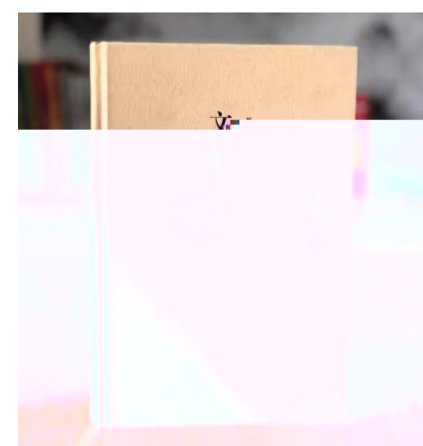
时光兜兜转转·依旧心心念念